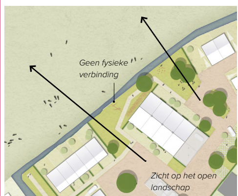
De relatie met het achterliggende landschap functioneel scheiden: