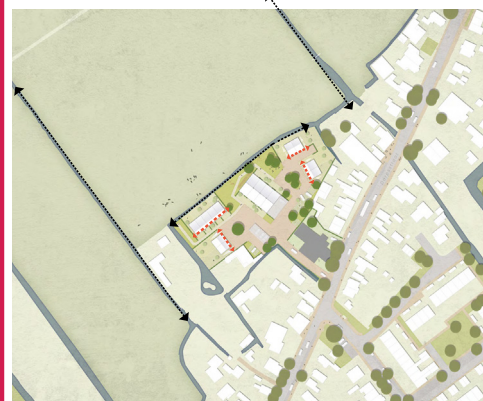
Bebouwing volgt de richting van de sloten in het slagenlandschap: