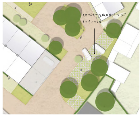
Groene inrichting van het erf, auto's uit het zicht: